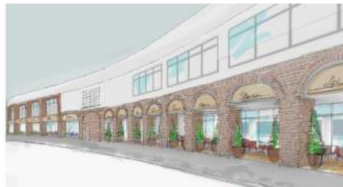
銀座1丁目 大型レストラン