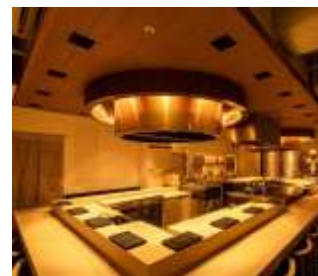
(上) 提供メニュー (下) 新宿東口店 内装