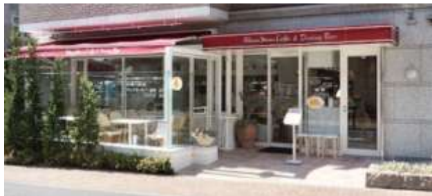
(上) 提供メニュー (下) 店舗外装