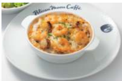
2024年10月開店 ペリカンムーンカフェ 一之江店